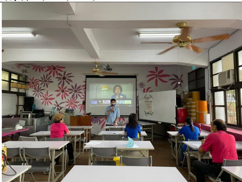
照片說明：於活動開始前播放臺中市社會局性平專區的影片宣導