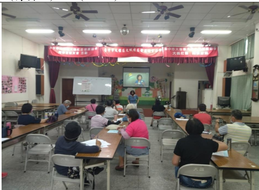
照片說明：於活動開始前播放臺中市社會局性平專區的影片