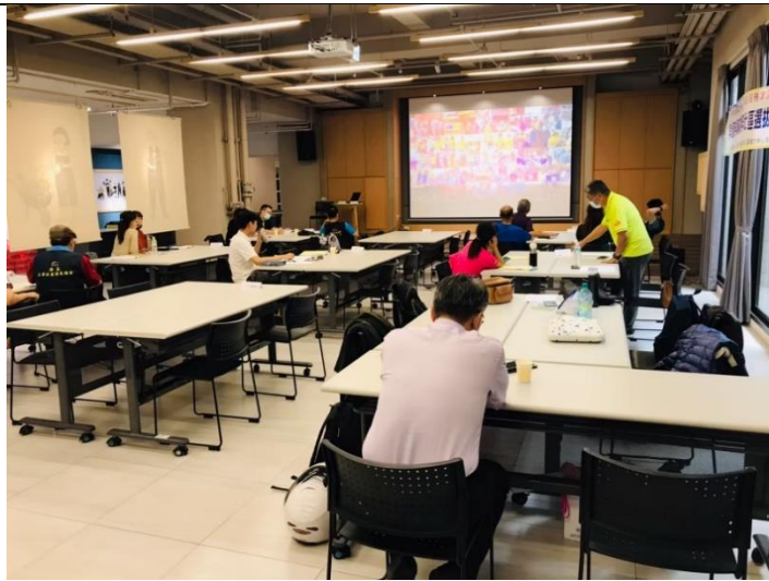
照片說明：於標竿社區說明會前宣導性別平等概念