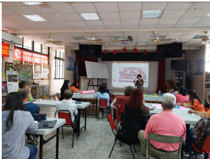
照片說明：播放家暴防治影片並進行宣導