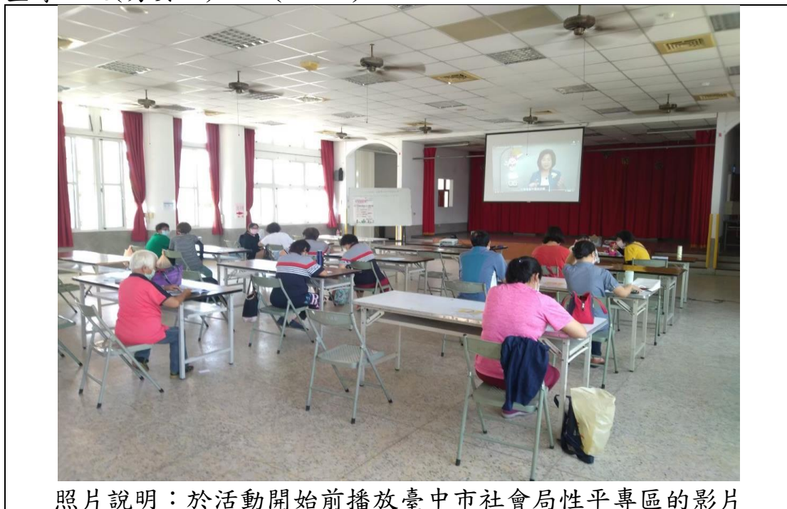
照片說明：於活動開始前播放臺中市社會局性平專區的影片