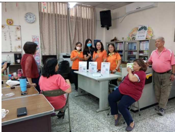
照片說明：於簽到處擺放性別主流化之宣導單