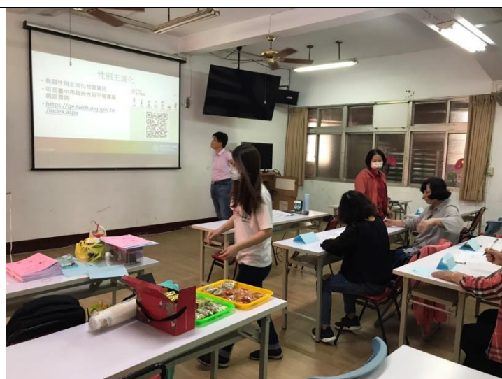
照片說明：宣導性別主流化之網址