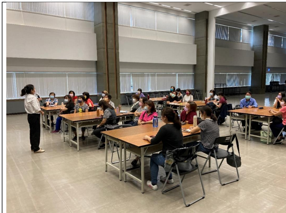
照片說明：社區女性幹部齊聚瞭解性平觀念