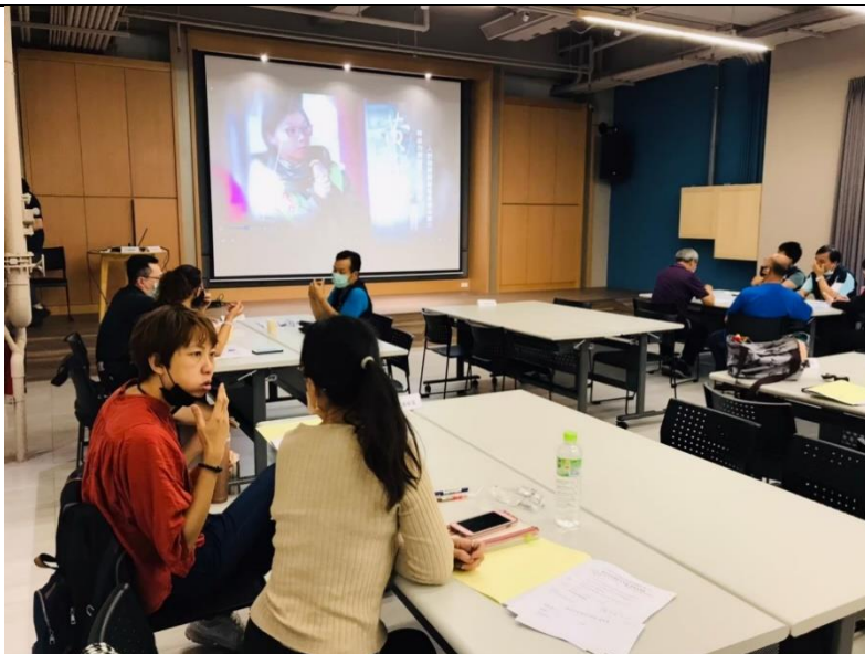
照片說明：於標竿社區說明會前宣導性別平等概念