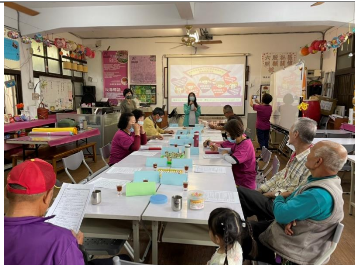
照片說明：播放家暴防治影片並進行宣導