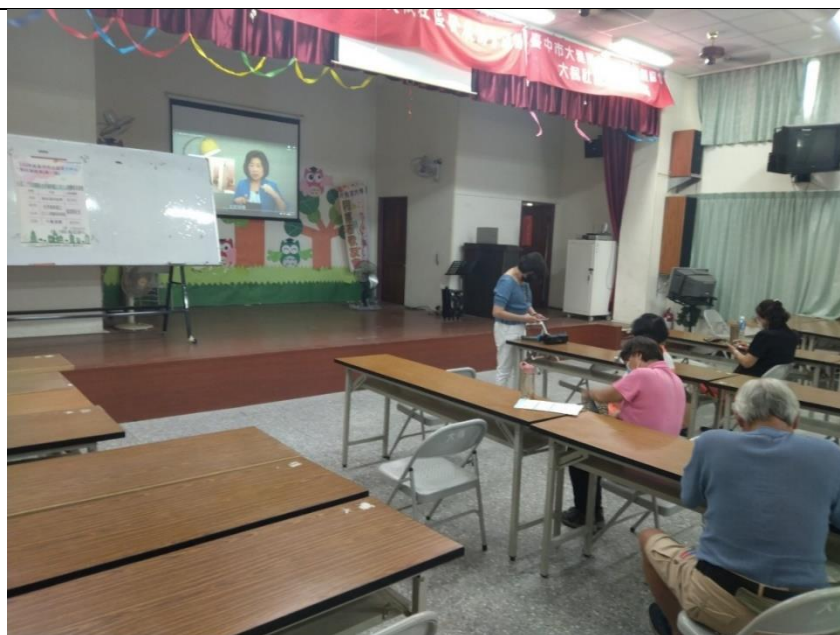
照片說明：播放臺中市社會局性平專區的影片