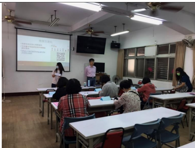
照片說明：輔導員介紹性別主流化之內容