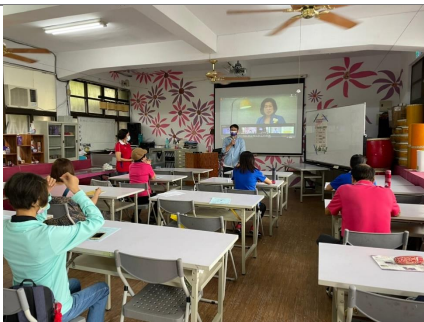
照片說明：介紹性平專區影片由學員自行閱覽