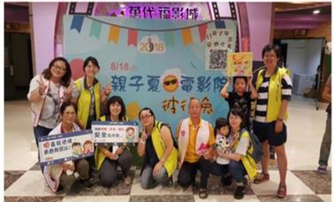
北區-親子夏日電影院