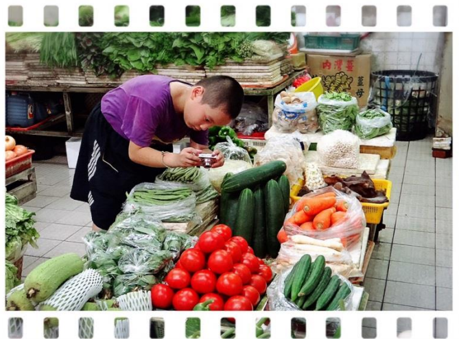
大甲中心-攝影課程