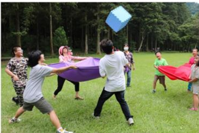
北屯區-傳遞月球互動活動