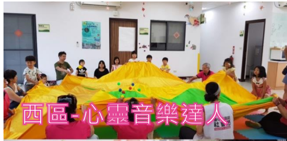
西區-心靈音樂達人