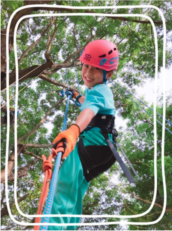
西屯中心-看見心視界親子團體