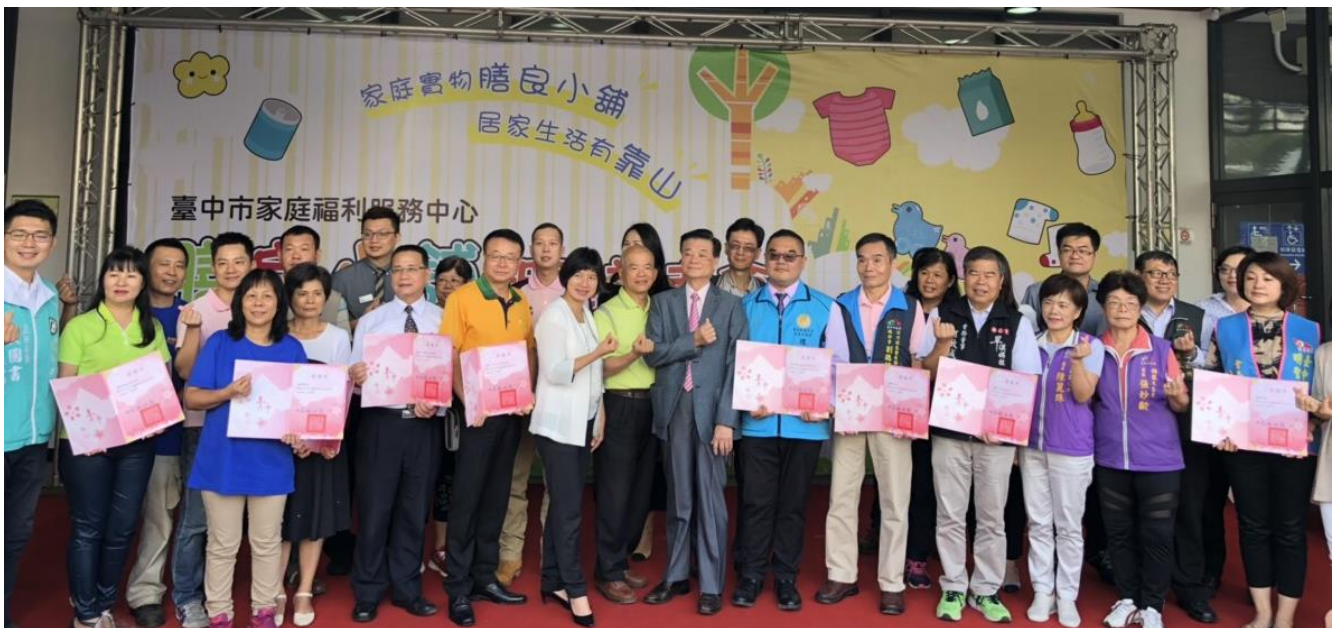
膳良小舖感謝長期提供物資與捐款協助的民間單位與善心人士

膳良小舖，透過各區家庭福利服務中心建構的區域福利服務網絡，並與食物銀行結合，藉此強化福利輸送之可近性與貼近實際需求，將物資就近送到有需要的弱勢家庭。台中市第一站膳良小舖設於臺中市西區家庭福利服務中心，後續將於各區家庭福利服務中心陸續設置。