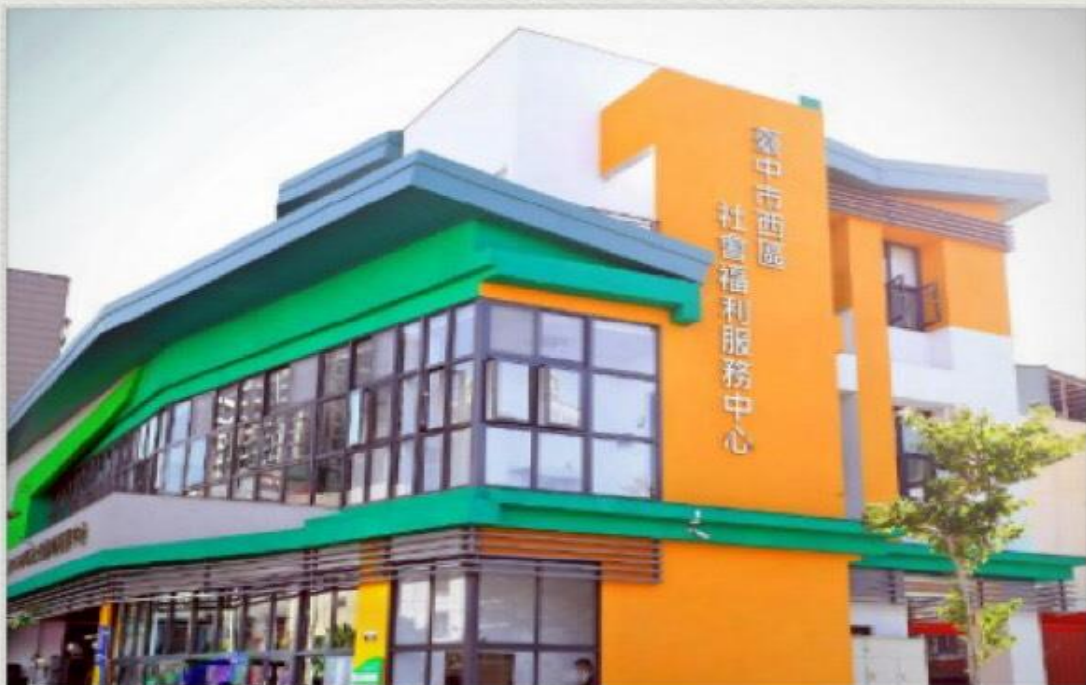
圖為西區家庭福利中心，想要了解離家最近的家庭福利服務中心地點與聯絡方式，請參閱電子報最後一頁

家庭福利服務中心是社區福利服務的 7-11，為家庭築起安全防護網。不管是您個人有需求，或是身邊周遭的人有需要，都可以一通電話，撥打 1999 市民熱線聯繫家庭福利服務中心，讓每個人都成為社區的守護者。