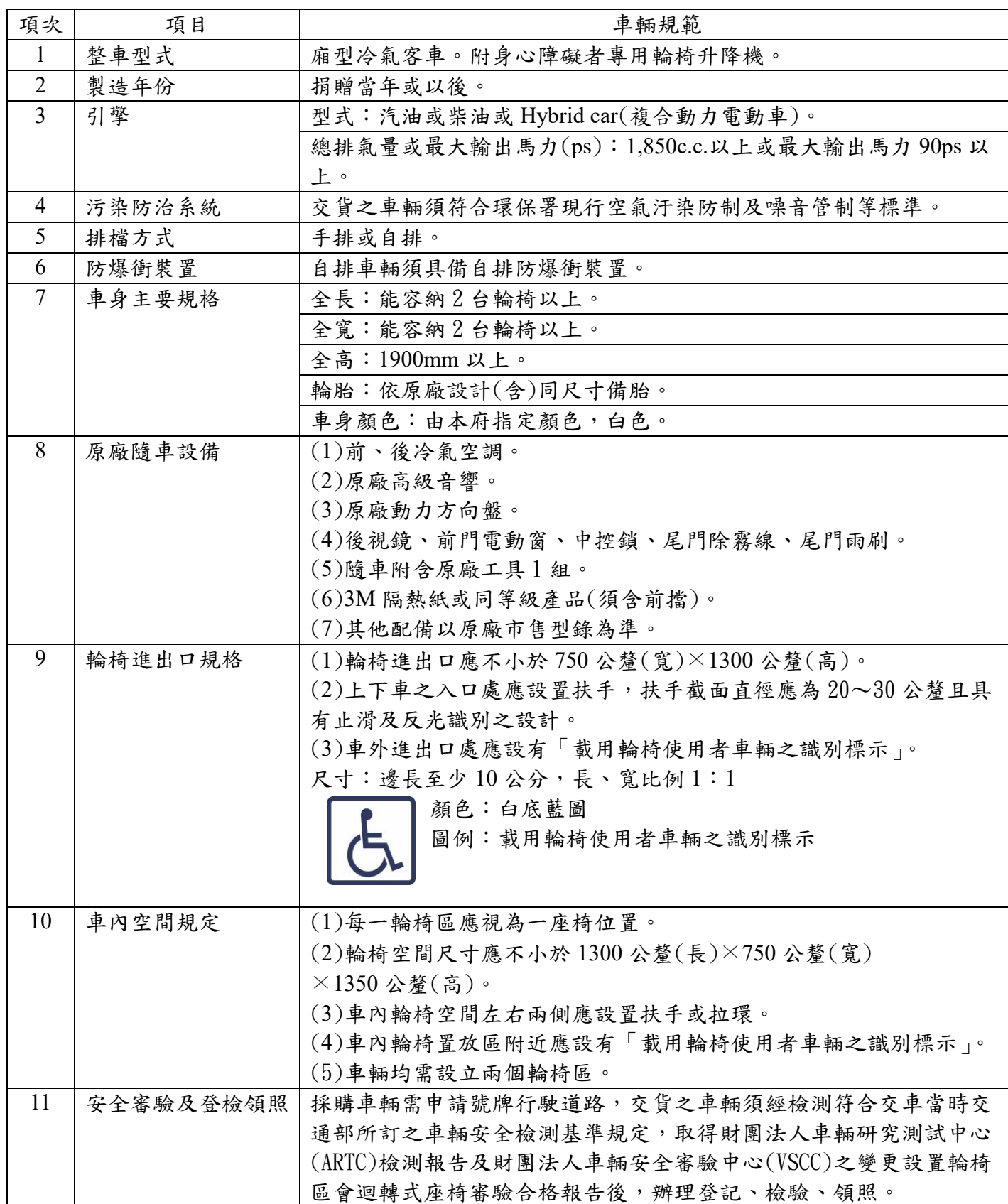
小型復康巴士基本配備規範表